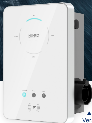
Version mit Schublade