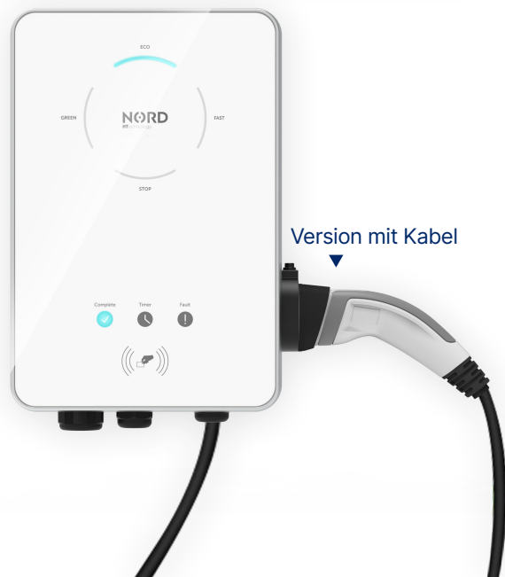
Version mit Kabel